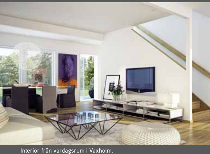
Interiör från vardagsrum i Vaxholm.