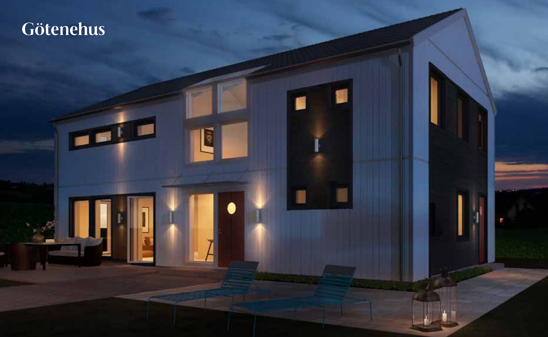
Huset visas med tillval.